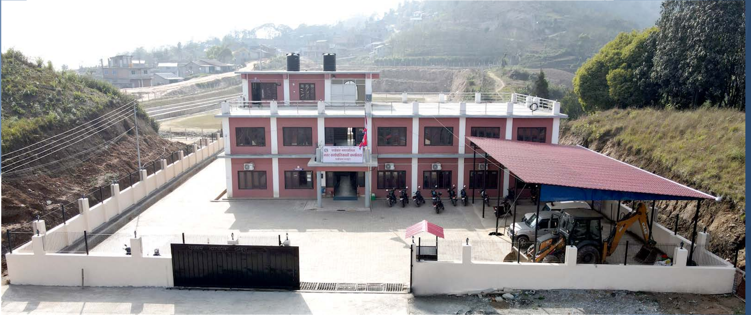
पाख्रीबास नगरपालिकाको भवन