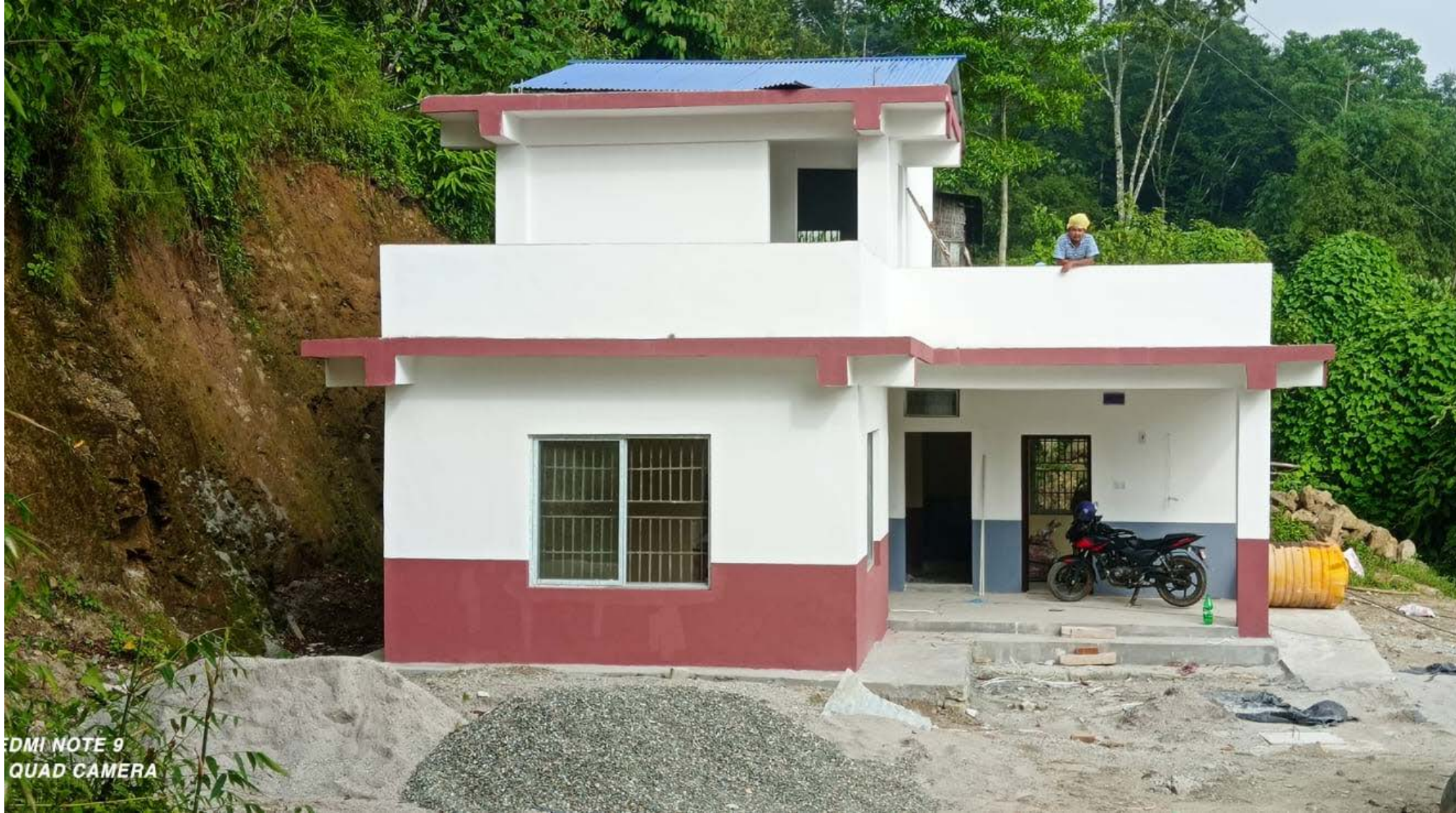
नव निर्मित ३ नं. वडा कार्यालय भवन