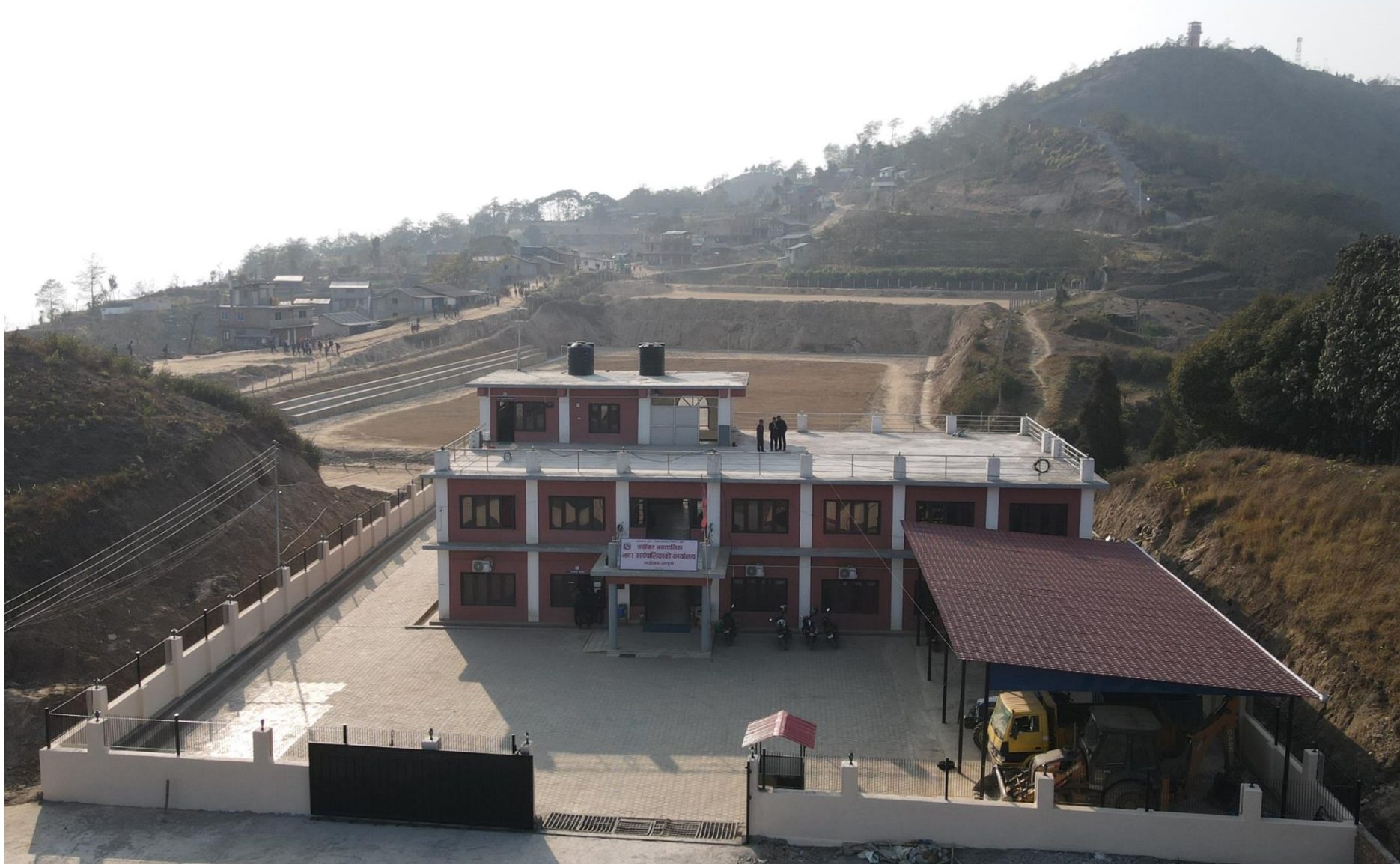
पाख्रीबास नगरपालिकाको नवनिर्मित भवन