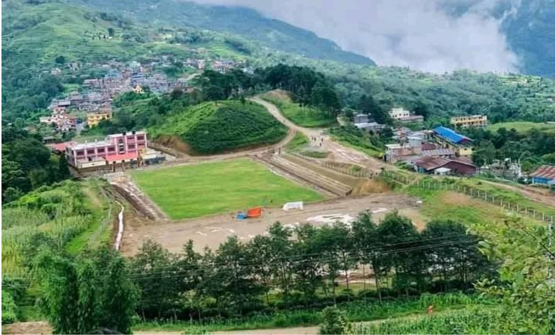
खेल मैदान पाख्रीबास