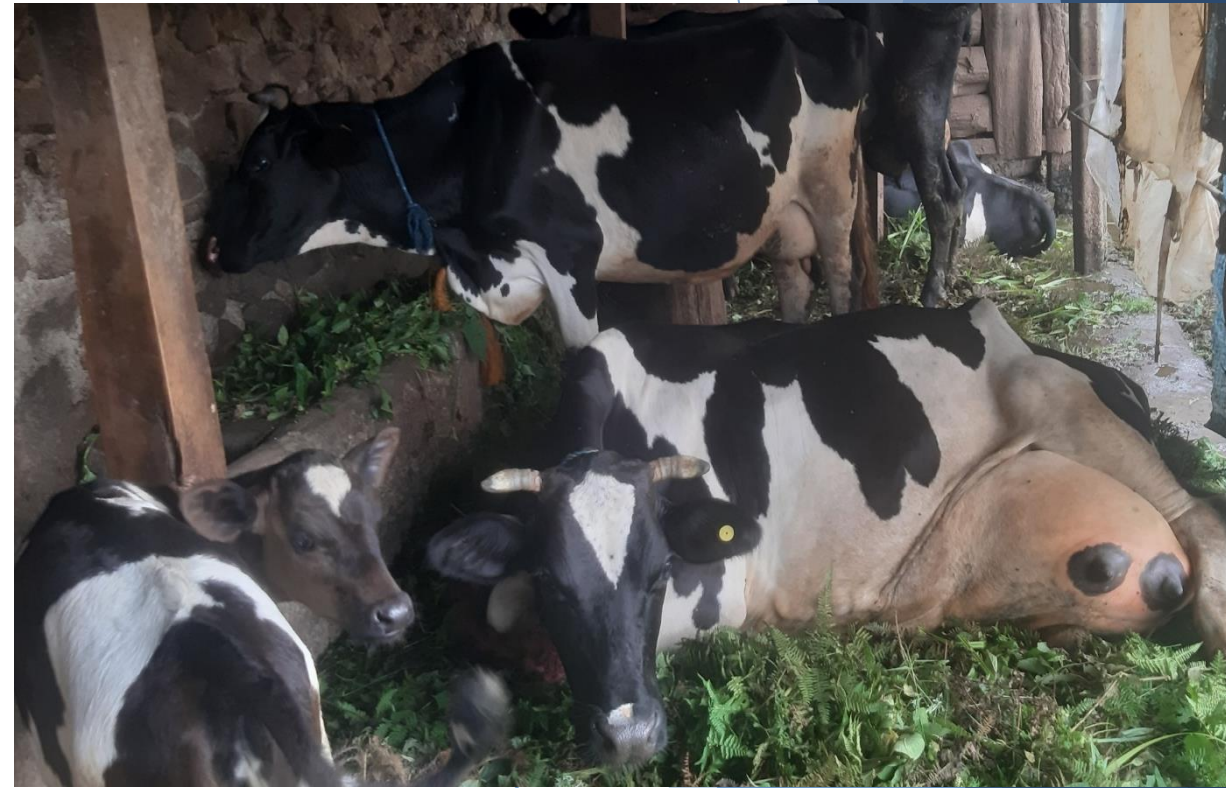
दूधमा आत्मा निर्भर पा.न.पा २ का कृषकहरु