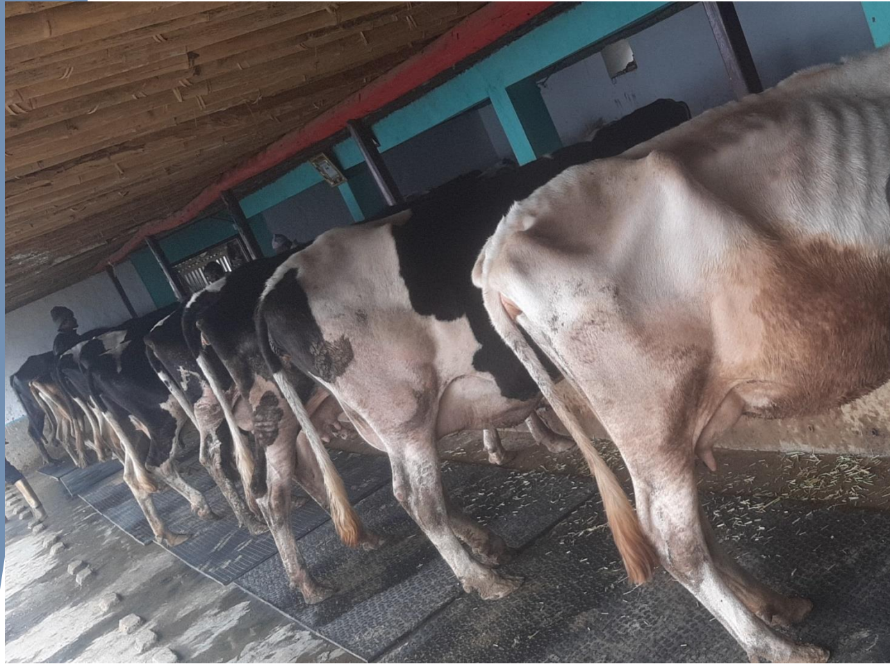
मोडल गाई फार्म (बस्नेत गौशाला) पा.न.पा.३