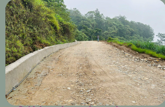
सिंहदेवी चोक मगाखोला उत्तरपानी सडक पाखीबास न.पा. ३