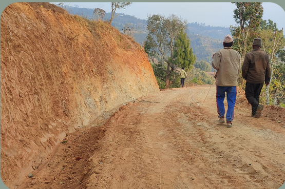
मण्डारीमोड थाक्ले पेवाङ सडक पाखीबास न.पा. ६