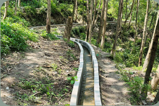
जामुने कुलो सिचाई योजना पाखीबास न.पा. २