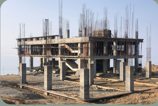
निर्माणधिन १५ शैया अस्पताल, पाखीबास न.पा. ८