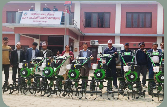
हाते ट्र्याक्टर वितरण कार्यक्रम