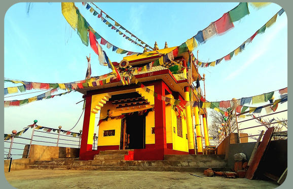
डिकुरे गुम्बा, पाख्रीबास न.पा. ५