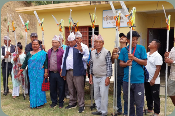
घोस भाने उपकरण वितरण कार्यक्रम