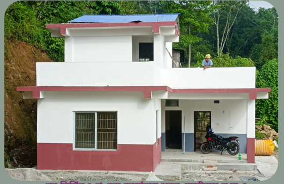
नव निर्मित ३ नं. वडा कार्यालय भवन, पाखीबास न.पा. ३