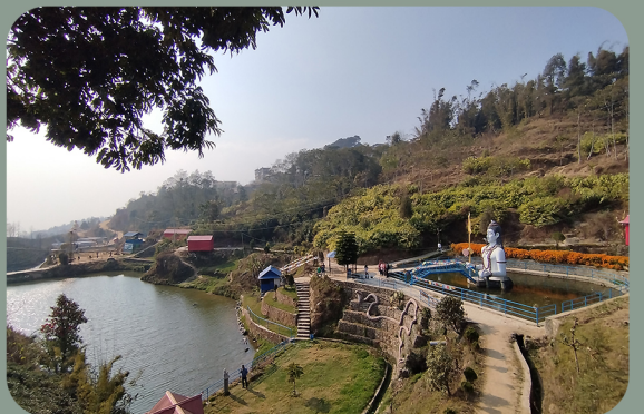
संसारीगाई सिमसार ताल