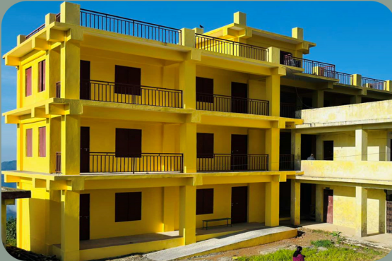
निर्माण सम्पन्न जलपादेवी नमना विद्यालयको भवन पाखीबास न.पा. ८