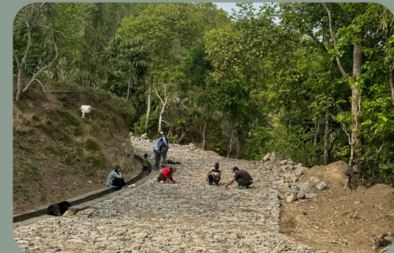
मूगा मालबासे अगास्ने उत्तरपानी सडक पाखीबास न.पा. ८ र ३