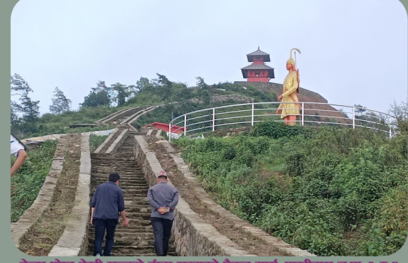
हेल्थ पोष्ट देखी सुन्तले डाँडा सम्मको पैदल मार्ग, पाखीबास न.पा. ३ र ८