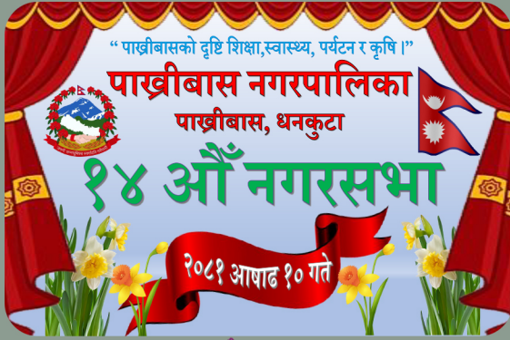
१४ औं नगरसभा