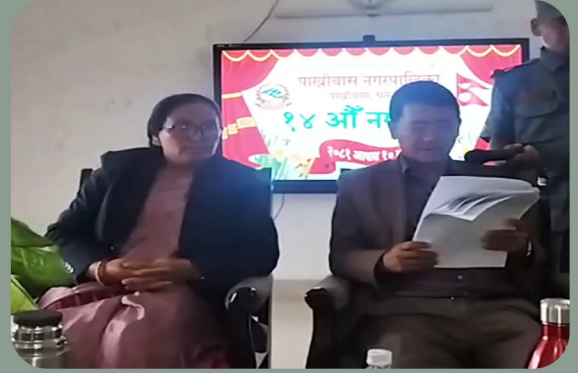
१४ औं नगरसभा कार्यक्रम